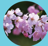
神代曙・陽春 4月上旬