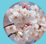
ソメイヨシノ 4月上旬